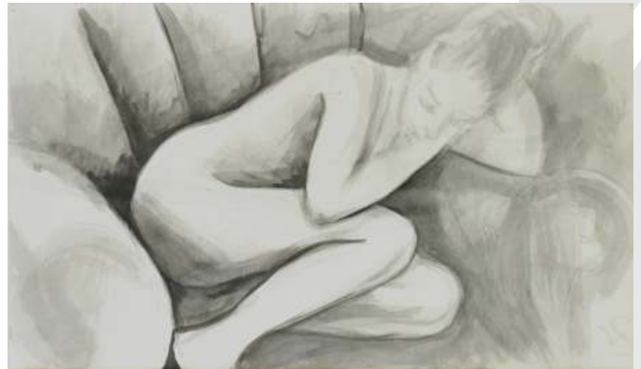
Sefcsik Viktor: Fekvő akt