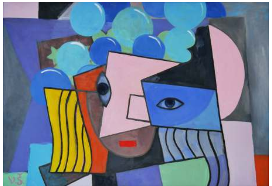
Sefcsik Viktor: Tisztelet Picassonak